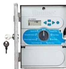
Nehrdzavejúca Oceľ Výška: 25 cm Šírka: 19 cm Hĺbka: 11 cm