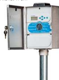
XCHSPOLE Súprava na uchytenie na stĺp (voliteľné) Výška: 1,2 m