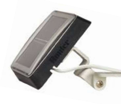
SPXCH Súprava solárneho panela (voliteľné) Výška: 8 cm Dĺžka: 25 cm Šírka: 8 cm