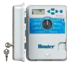
Plast Výška: 22 cm Šírka: 18 cm Hĺbka: 10 cm