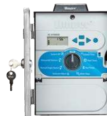
Nehrdzavejúca Oceľ, Solárny Panel Výška: 27 cm Šírka: 19 cm Hĺbka: 11 cm