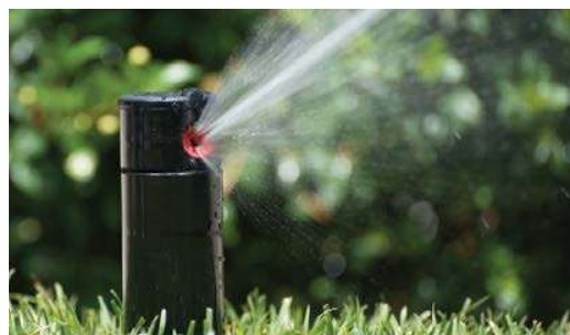
Červená Tryska PGP-ADJ

PGP-ADJ -07 = 10 cm výsuv, nastaviteľná výšec a červená tryska č. 7